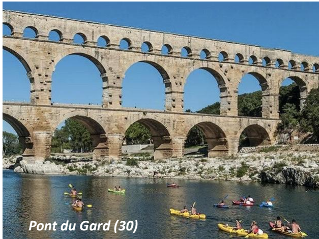
Pont du Gard (30)