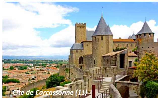
Cité de Carcassonne (11)