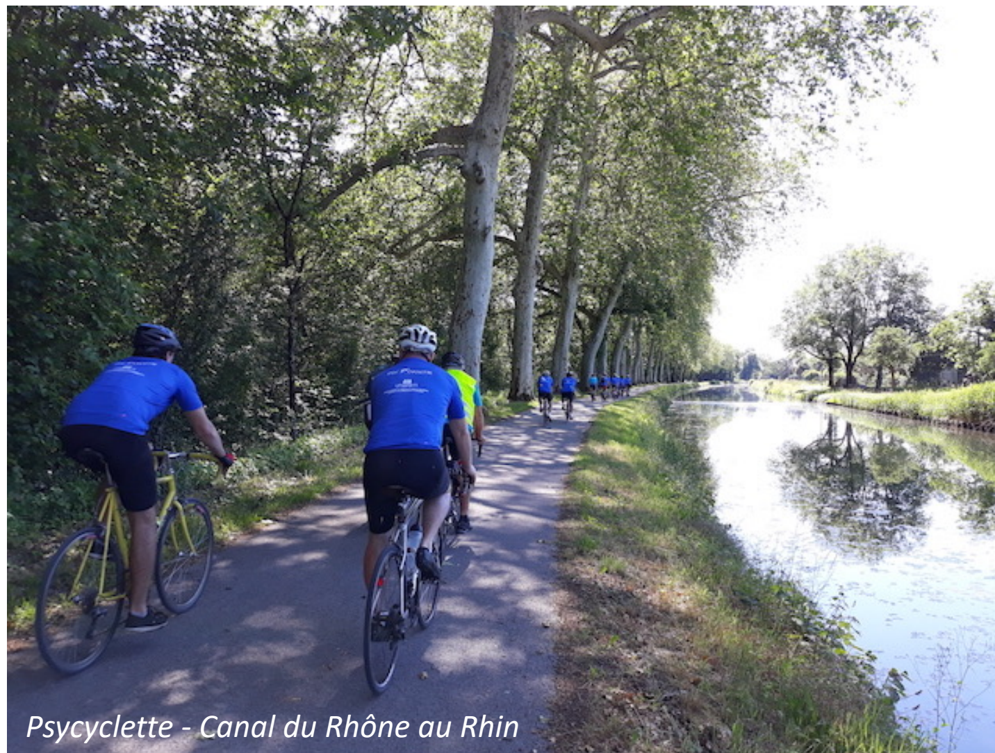
Psycyclette - Canal du Rhône au Rhin